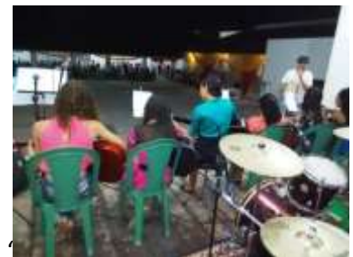
Hier unsere Gitarrengruppe beim Auftritt

Im Dezember konnten wir einheimische Künstler für ein Benefizkonzert gewinnen. Auch wenn nicht so viele Besucher wie gewünscht erschienen sind, so war es doch einfach ein schönes Ereignis, das auch den Namen unseres Projektes bekannt gemacht hat.