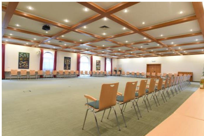
Rosa-Bauer-Saal im Franziskanischen Zentrum

Sprechen Sie Ihre Veranstaltungswünsche mit uns ab. Gerne kombinieren wir Ihre Veranstaltung mit anderen Angeboten des Klosters, z.B. einer Kloster- oder Gartenführung (abhängig von den Möglichkeiten an Ihrem gewünschten Termin).