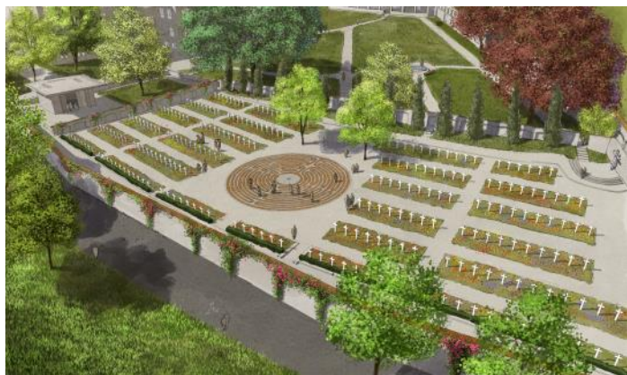
Die Vision unsere Klosterfriedhofs, Stand Juli 2023

Am Rand des Friedhofs steht die neue Aussegnungshalle, die aus Stampflehm errichtet wurde. Gerne erschließen wir Ihnen diese Orte in einer Führung.